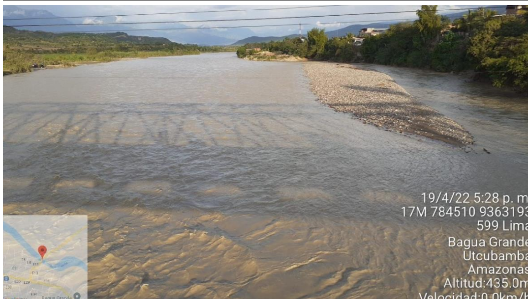
FIGURA N°01: TRAMO CRÍTICO EN EL CAUCE DEL RIO UTCUBAMBA, EN EL PUENTE NARANJITOS PRESENTANDO EROSION EN MARGEN DERECHA DEL RIO EN EL SECTOR NARANJITOS, DISTRITO DE CAJARURO, PROVINCIA UTCUBAMBA - AMAZONAS