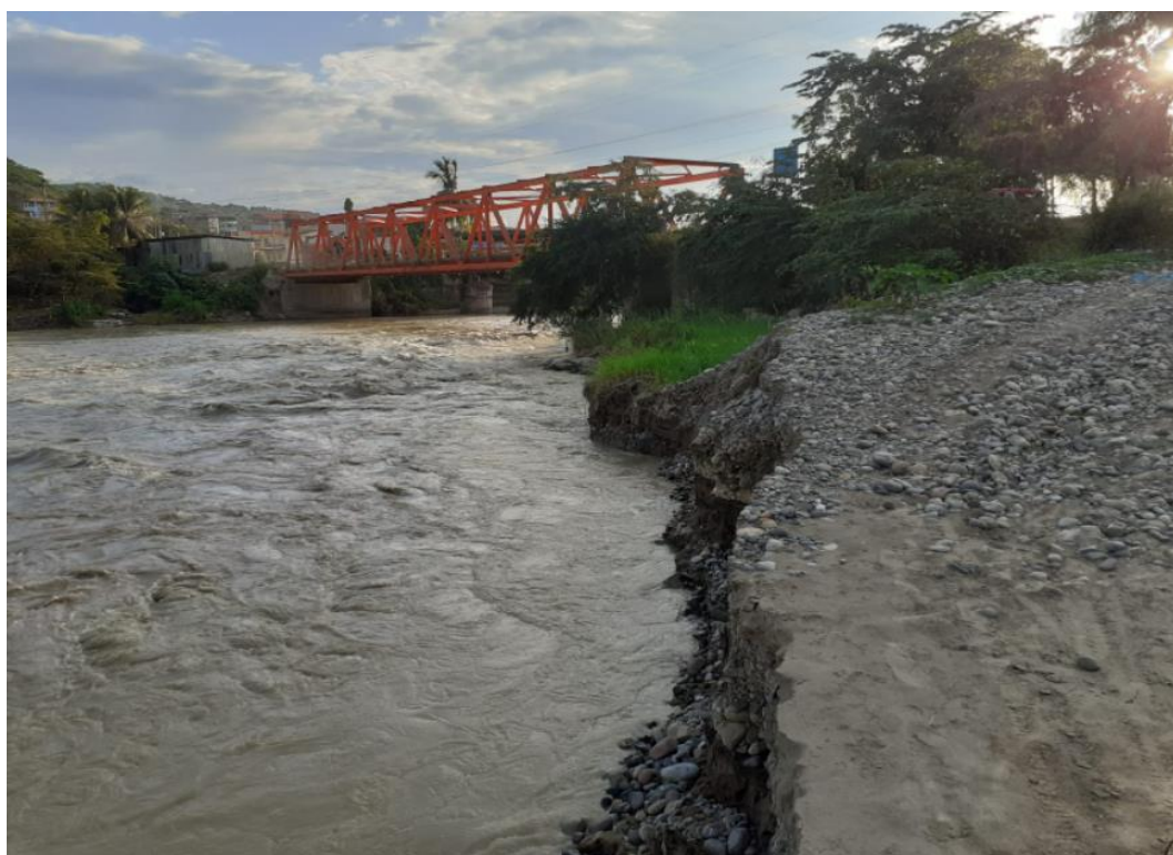
FIGURA N°02: TRAMO CRÍTICO EN EL CAUCE DEL RIO UTCUBAMBA, EN EL PUENTE NARANJITOS PRESENTANDO EROSION EN MARGEN DERECHA DEL RIO EN EL SECTOR NARANJITOS, DISTRITO DE CAJARURO, PROVINCIA UTCUBAMBA - AMAZONAS